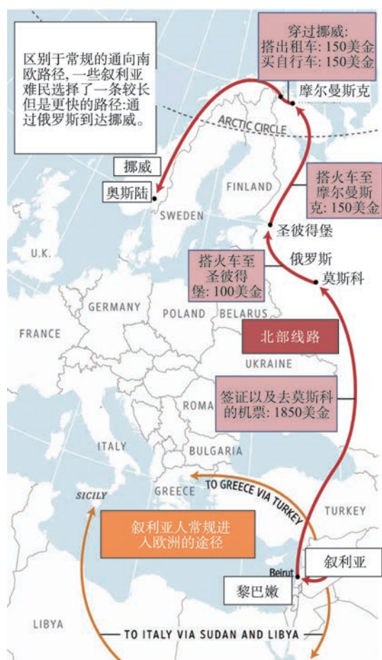
图2 叙利亚难民的移民路线